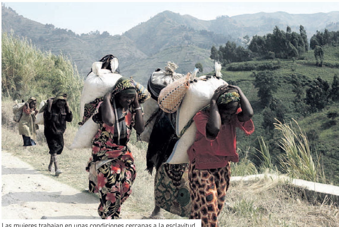
Las mujeres trabajan en unas condiciones cercanas a la esclavitud.