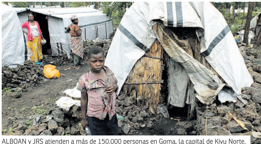
ALBOAN y JRS atienden a más de 150.000 personas en Goma, la capital de Kivu Norte.