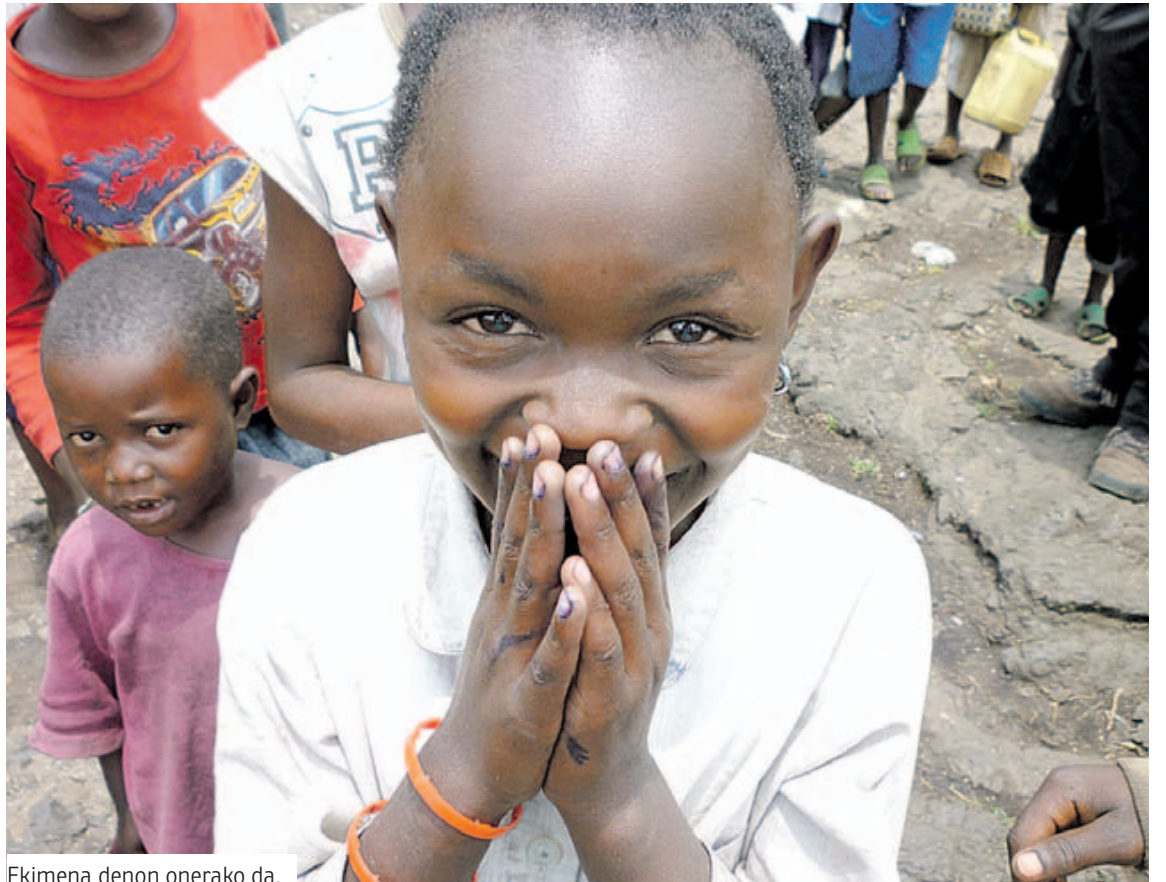
Ekimena denon onerako da.

Gatazkarik Gabeko Teknologia ekimena, funtsean, garapenerako hezkuntza proposamena da. Mugikor, tablet eta ordenagailuek Kongoko Errepublika Demokratikoaren ekialdean dauden gerrarekin duten lotura ezagutaraztea da bere helburu nagusia. Zentzu horretan, ikastolen parte-hartzea oso lagungarria izango da ekimena hedatu eta gizarteratzeko. Dena den,