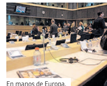
En manos de Europa.

Desde la coalición de ONG europeas, de la que ALBOAN forma parte, se pide a los gobiernos que reconsideren su postura y retomen el liderazgo en esta materia. Se solicita que apoyen una regulación obligatoria, en sinto-