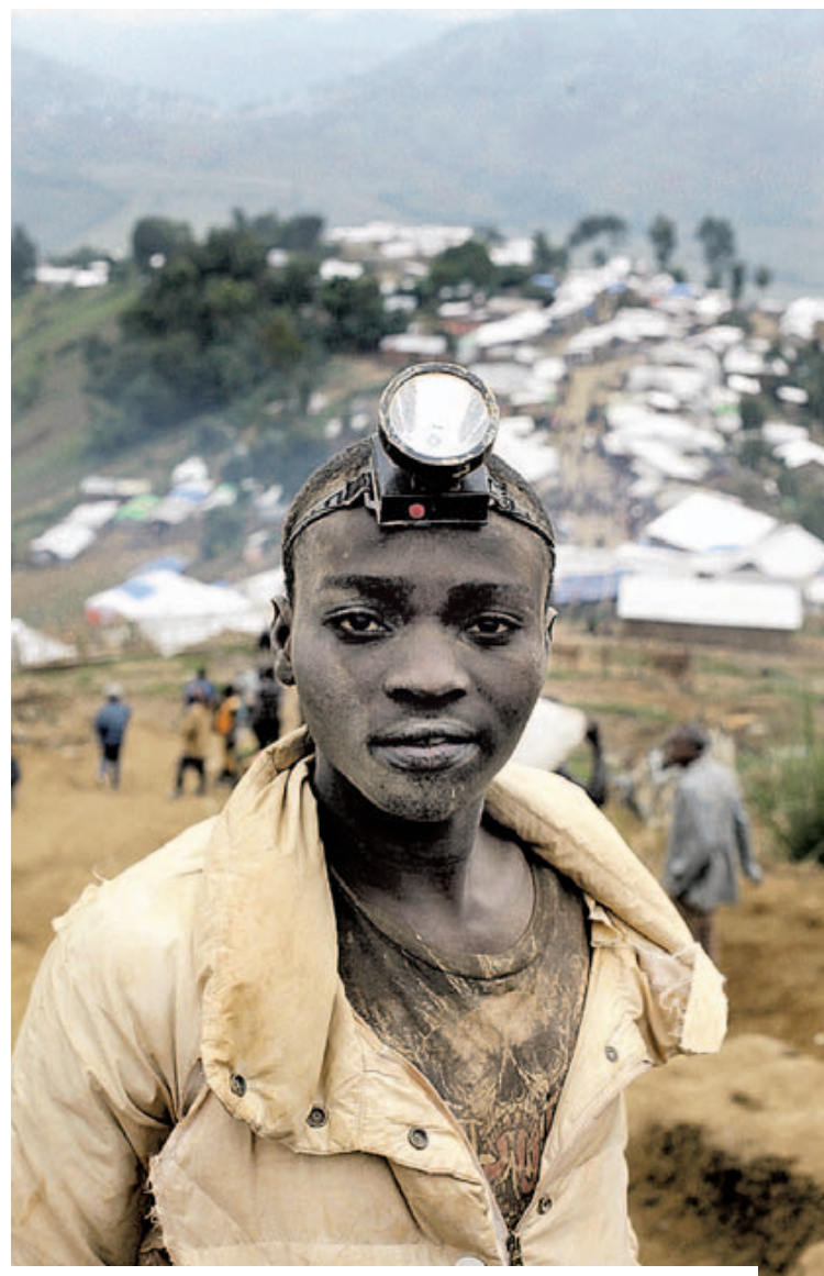
La extracción se realiza sin las más mínimas medidas de seguridad.