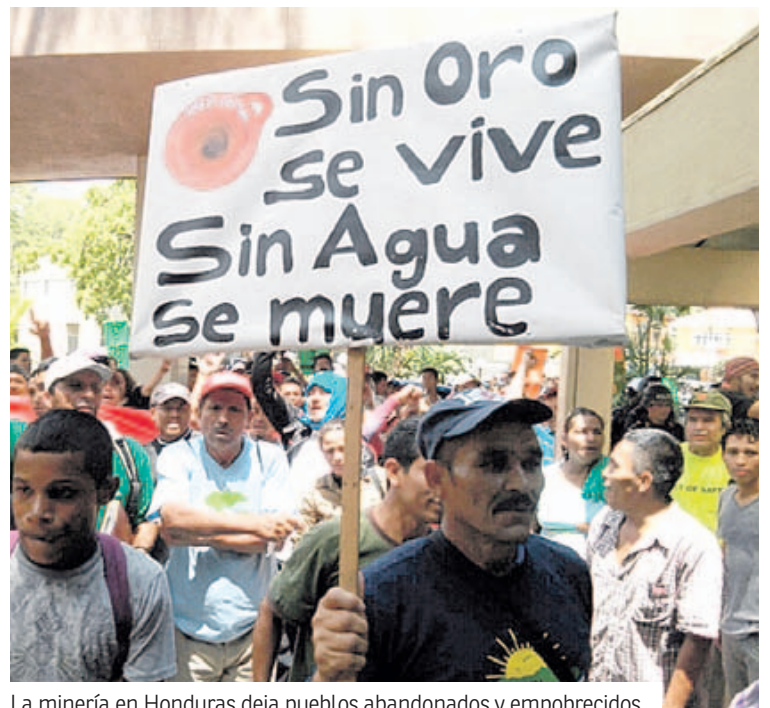
La minería en Honduras deja pueblos abandonados y empobrecidos.

La minería en Honduras deja pueblos abandonados y empobrecidos, ríos contaminados por tóxicos y sus desechos, que ocasionan serios problemas de salud entre la población y en numerosas ocasiones la muerte. Además de la pérdida de ecosistemas, y en algunos casos desplazamiento de asentamientos humanos. La minería en Honduras juega