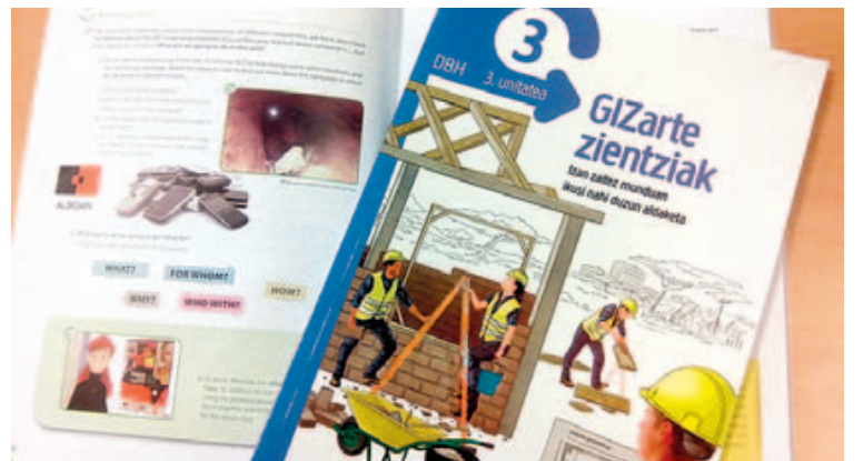
DBHko 3.mailako Gizarte Zientzietako testu-liburuetan sartzen da kanpaina.

GGT ekimenarekin kolaboratzeko interesa duen edozein ikasleek aukera dauka gure proposamenean parte hartzeko. Horretarako jarri, mesedez, kontaktuan educacion@alboan.org helbidera idatziz edo 902 999 221 telefonora deituz