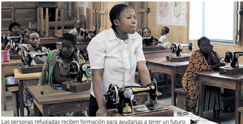
Las personas refugiadas reciben formación para ayudarlas a tener un futuro.