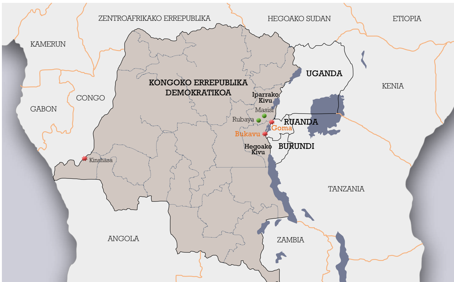
1. mapa. Aintzira Handiak eta Rubayako eskualdea, Iparraldeko Kivuko probintzian, Kongoko Errepublika Demokratikoko ekialdean

Gai horiei erantzuteko hautatutako meatzekokapenak Rubaya eta inguruetakoko herrixkak izan dira, Masisi lurraldean, Iparraldeko Kivuko probintzian, Kongoko Errepublika Demokratikoan. Erkidego horietako meatze-ustiategi gehienak koltana ateratzen aritzen dira, eta, ziurtagiria lortzen lehenak izan direnez, erkidegoak izandako efektuak aztertu nahi ditugu.